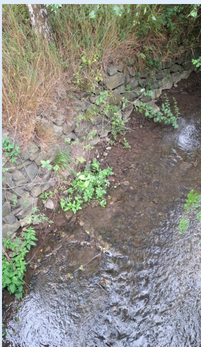
Niveau très bas au Mosselbach

Compte-tenu des conditions météorologiques et de l'évolution de la situation hydrologique, les préfectures du Haut-Rhin, du Bas-Rhin et de la Moselle ont décidé de placer dès juin une partie de leur territoire en vigilance, alerte, alerte renforcée ou crise sécheresse.