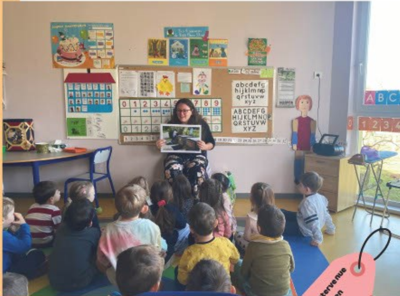
Animation à l'école de Menchhoffen.